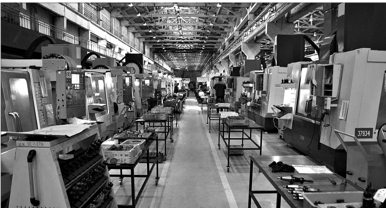
Линейка станков с программным управлением в производстве №1.