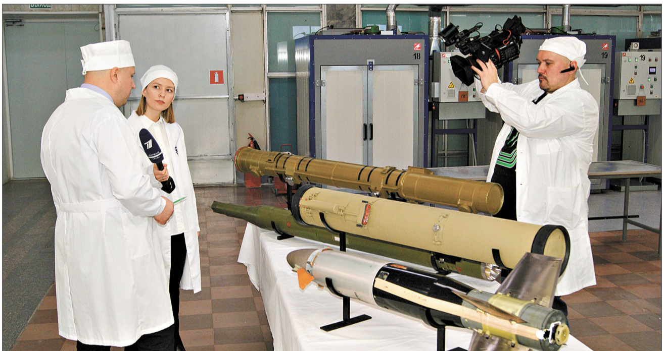
Съемочная группа Первого канала в производстве № 9.