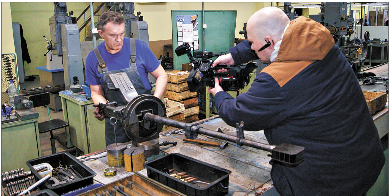
Съемочная группа Первого канала в производстве № 1.