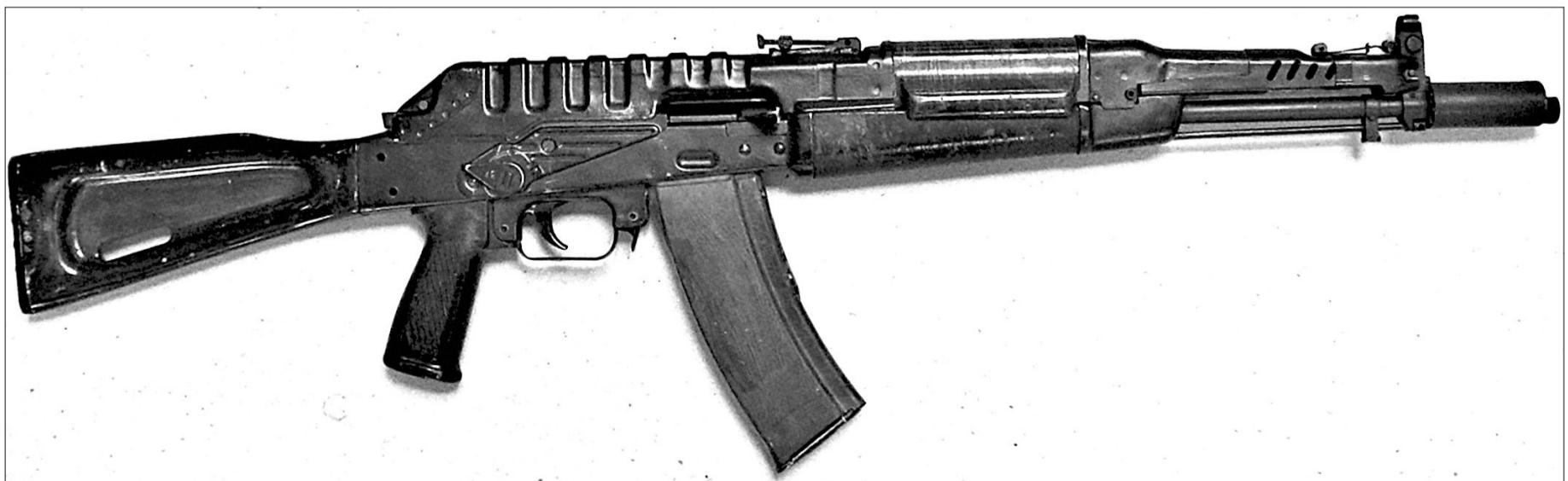
5,45-мм автомат СА-006. Опытный образец.

Инженер-подполковник А.А. Малимон, служивший на Научно-исследовательском полигоне стрелкового и минометного вооружения (НИПСМВО, известный как Щуров-