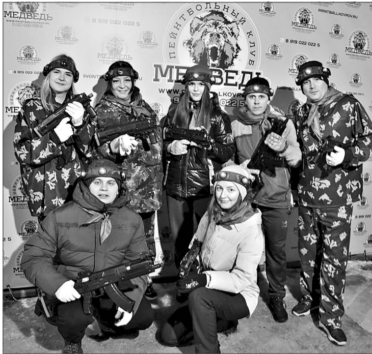
На игре в пейнтбол.