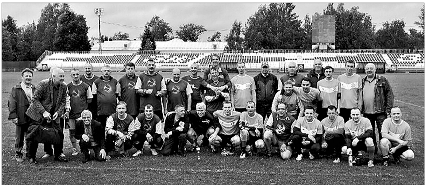
Футбольный матч «Ветераны-молодёжь».