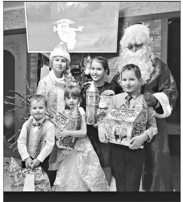
Дед Мороз и Снегурочка поздравляют детей работников производства.