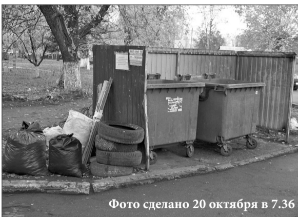
Фото сделано 20 октября в 7.36

Собственником контейнерной площадки, расположенная у памятника А.В. Лопатину (ул. Лопатина, д. 44), является ООО УК «Сфера». В адрес управляющей компании направлено письмо о необходимости приведения контейнерной площадки и прилегающей к ней территории в надлежащее состояние.