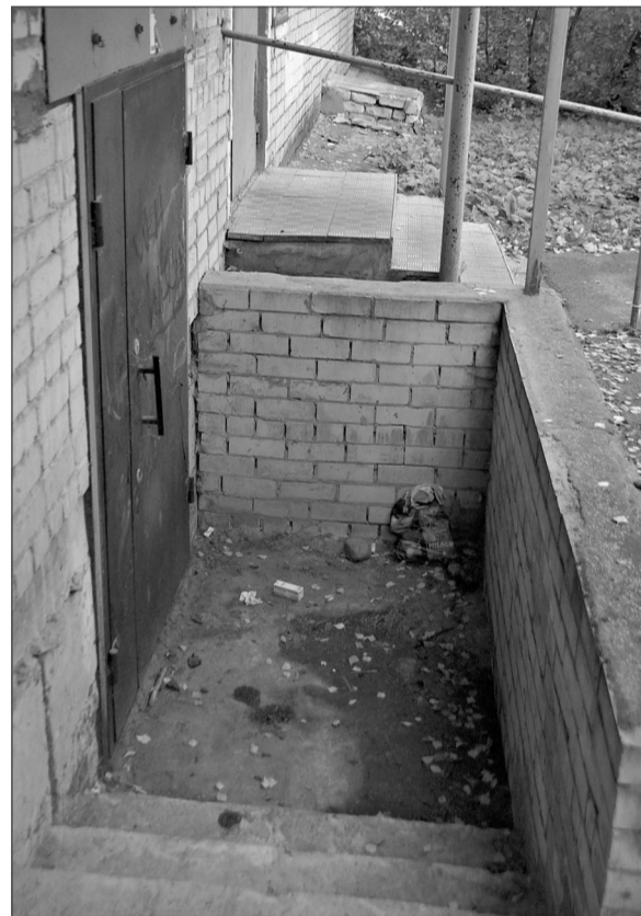
Мокрое пятно у входа в подвал у подъезда 3 не просыхает неделями.

И это не дождь... Не заметить его трудно.