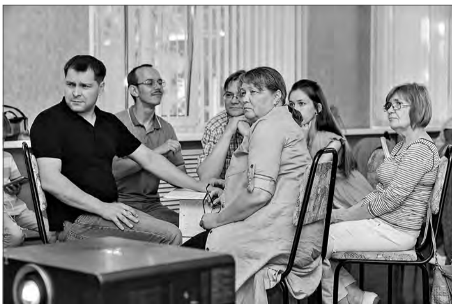
Команда «Мозговые рыбаки».