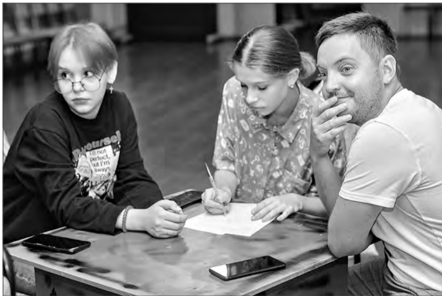
Команда «Мы не придумали».