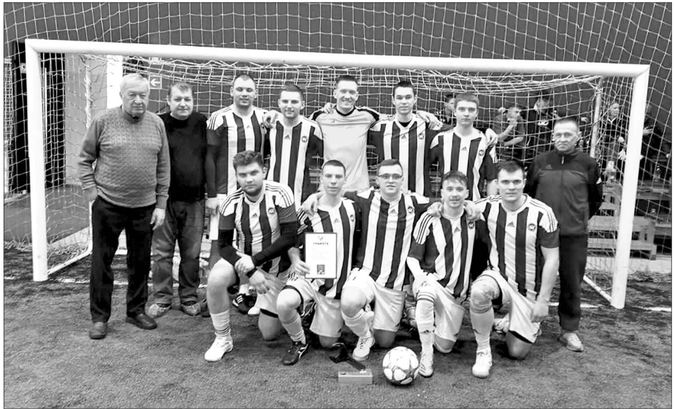
Команда ФК «Зид» – победитель турнира в Муроме.

Таким образом, второй год подряд первое место в турнире заняла футбольная команда завода