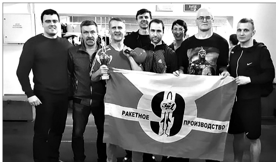
Команда производства №9.