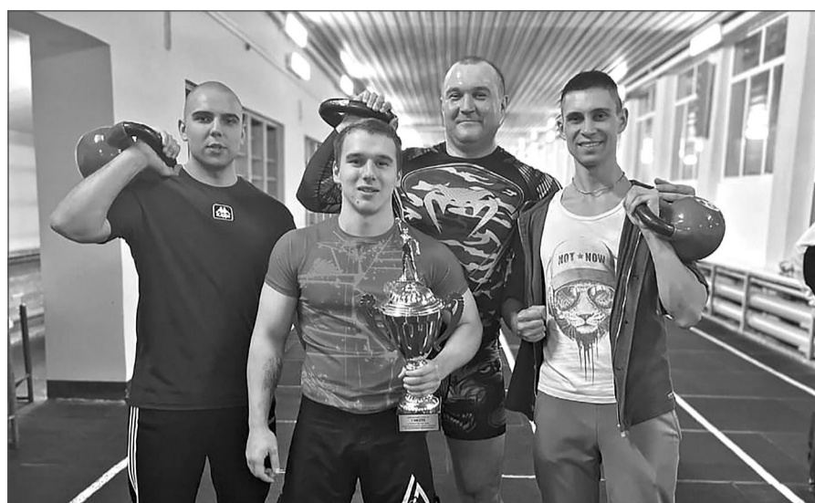
Команда производства №2.