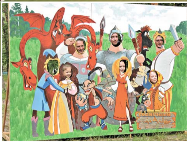
В этом году детскому оздоровительному лагерю «Солнечный» исполнилось 76 лет.